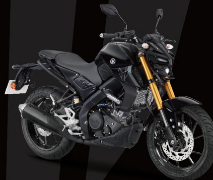
Metallic Black 黑 I88061