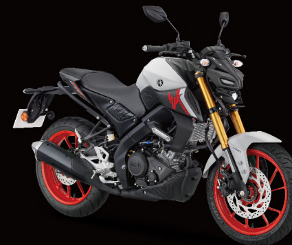
Ice Fluo-Vermillion 淺灰黑 (消光) I88DM1