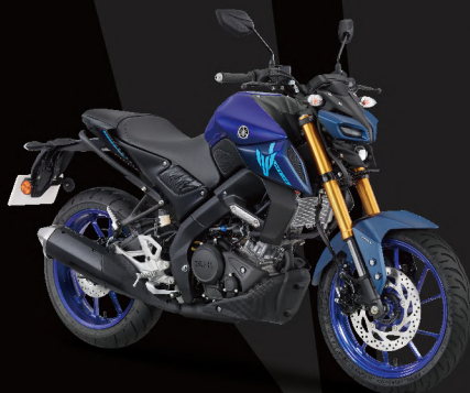
Racing Blue 藍深灰 I88BQ1