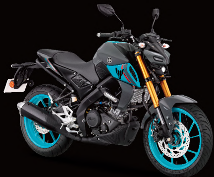
Cyan Storm 灰深灰 I88911