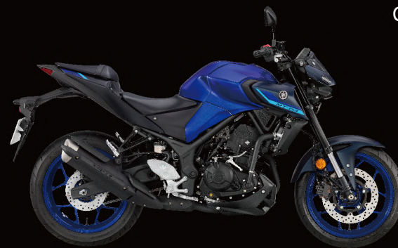
Icon Blue 標誌藍 藍黑 I82422