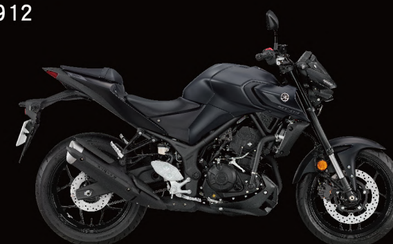
Midnight Black 午夜黑(消光) 深灰黑 I82AE2