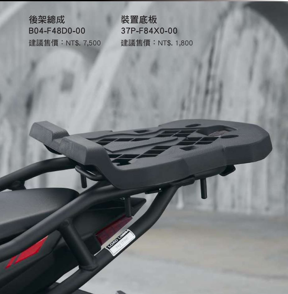
後架總成 B04-F48D0-00 建議售價：NT$. 7,500