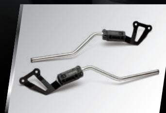
軟式側包支架 B04-FSSBS-00 建議售價：NT$. 3,700