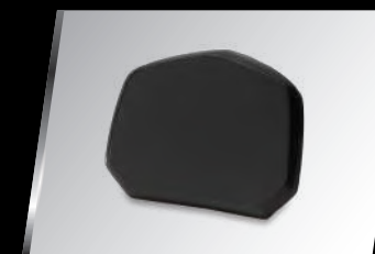
50公升乘客靠墊 37P-F84U0-B0-00 建議售價：NT$. 1,800