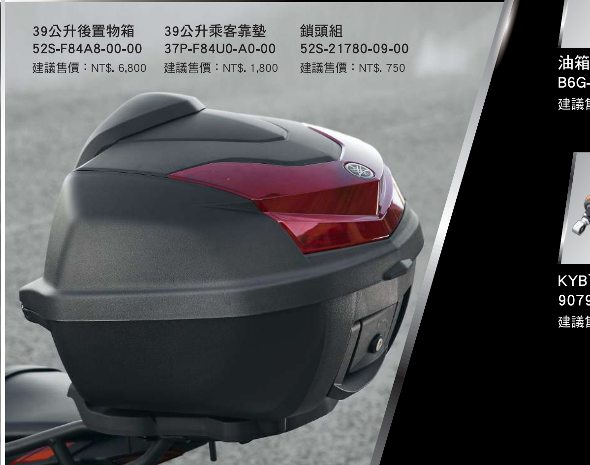
39公升後置物箱 52S-F84A8-00-00 建議售價：NT$. 6,800