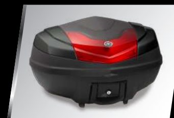
50公升後置物箱 34B-F84A8-10-00 建議售價：NT$. 8,800