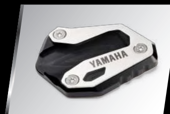
側支架襯墊 B04-FSTEX-00 建議售價：NT$. 2,800