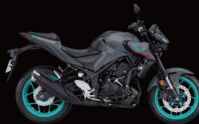
Cyan Storm 暴風青 灰深灰 I82912