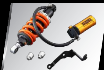
KYB可調式後避器 90798-1Y739-00 建議售價：NT$. 29,000