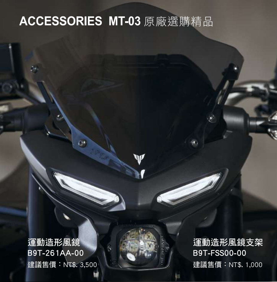
運動造形風鏡 B9T-261AA-00 建議售價：NT$. 3,500