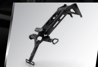
短牌架 B9T-F16E0-00 建議售價：NT$. 5,200