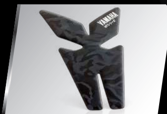
油箱保護貼 B6G-FTPAD-00 建議售價：NT$. 1,000

在四輪高性能車輛中發展成熟的“Performance Damper”的兩輪專用版本。保持了車架的彈性並強化穩定性，有效抑制行駛過程中車身產生的振動和變形，提高乘坐舒適性與操控感。