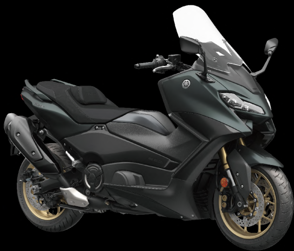
Dark Petrol 深灰綠 I80CF2