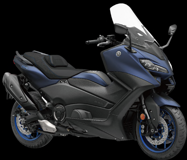
Icon Blue 藍深灰 I81BQ2