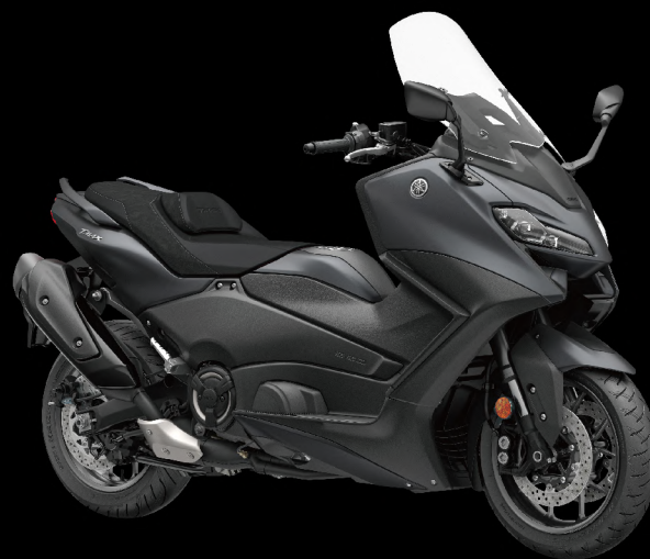
Sonic Grey 深灰黑 I81AE2